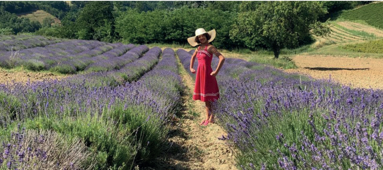
en Vermont

Paneles solares Luces LED térmicas solares Uso de una bomba de calor Recogida del las aguas pluviales Uso de detergentes respetuosos con el medioambiente Reducción del 80% de las emisiones de CO2