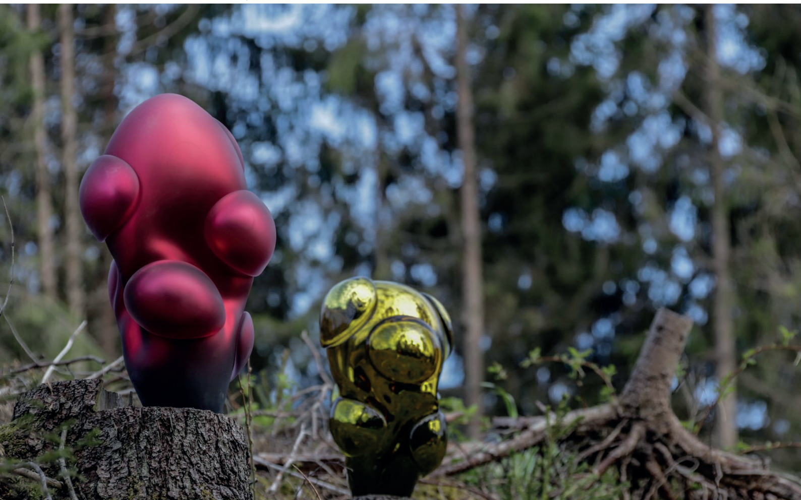
Obra de Remigijus Kriukas “Glasremis”

Ciudades y pueblos pequeños Gente de todas las edades Artesanos Tradición Patrimonio cultural Experiencia y pasión