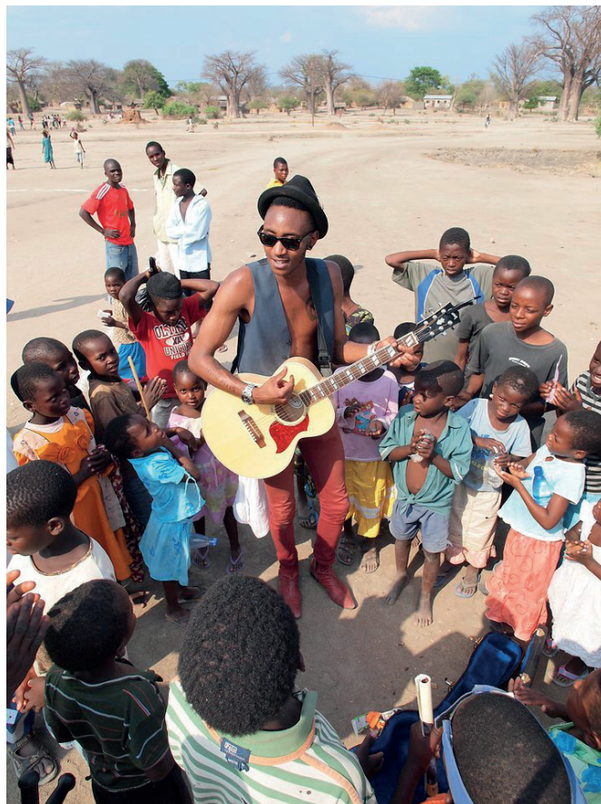
Festival Lake of Stars, en Malawi

Sí, el Festival Lake of Stars , en Malawi. Trabajamos muy estrechamente con la comunidad y hay dos escuelas en la zona. En una de ellas, cuando la visité, me di cuenta de que los escolares estaban sentados en un suelo de cemento, aprendiendo delante del profesor, no había pupitres. Hablé con el director de la escuela, y me dijo: "¿Qué vais a hacer con el escenario al final del festival?" Era un escenario de madera, que construimos específicamente para el festival. Se lo dimos a la escuela y ellos lo convirtieron en pupitres. Cuando volví un año después, entré en las aulas y los niños estaban sentados en pupitres hechos con el escenario que había utilizado el festival y en el que habían actuado los artistas. Para mí, es un gran ejemplo de Economía Circular. Ellos utilizaron sus habilidades y sus esfuerzos. Sólo necesitaban la madera, que no podían permitirse comprar normalmente.