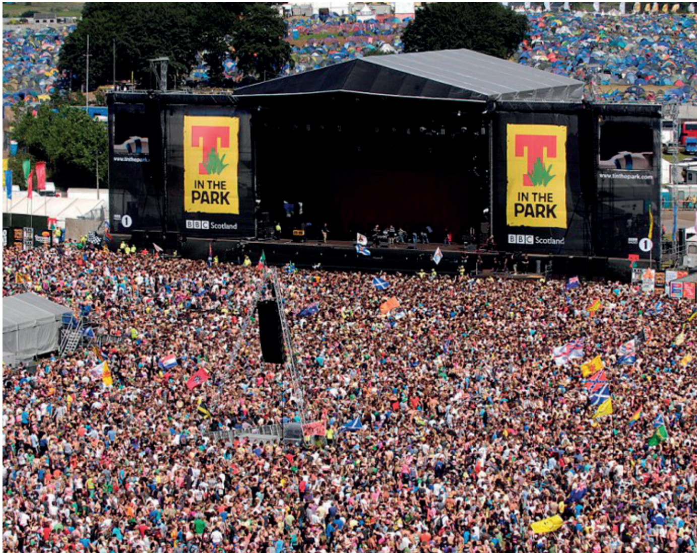
Festival de música "T IN THE PARK", Glasgow

Creatividad Innovación Oportunidades de negocio Estrategias hechas a medida