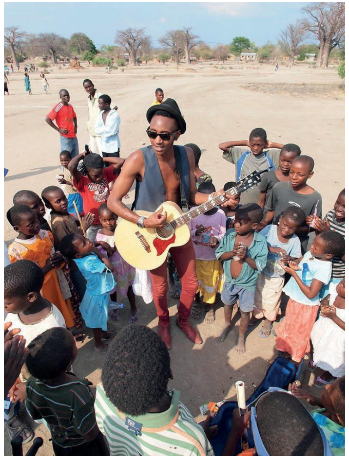
„Laker Stars“ festivalis Malavyje

Malavyje vykstančiame festivalyje „Laker Stars“ labai glaudžiai bendradarbiaujame su bendruomene. Šioje vietovėje yra dvi mokyklos. Kai apsilankiau vienoje iš jų, pastebėjau, kad mokiniai sėdi ant betoninių grindų priešais mokytoją, jie neturi stalų. Pasikalbėjau su mokyklos direktoriumi. Jis manęs paklausė, ką ketiname daryti su scena po festivalio. Tai buvo medinė scena, specialiai pastatyta renginiui. Ir tą sceną atidavėme mokyklai. Jie tą sceną pavertė rašomaisiais stalais. Ir kai grįžau po metų, nuėjau į klases ir vaikai sėdėjo prie stalų, pagamintų iš scenos, kuri buvo naudota muzikantų festivalio metu. Man yra puiki žiedinės ekonomikos istorija. Jiems tiesiog reikėjo medienos, kurios jie negalėjo sau leisti įprastai nusipirkti, o šios iniciatyvos dėka jie galėjo problemą išspręsti panaudoję tik savo darbą,