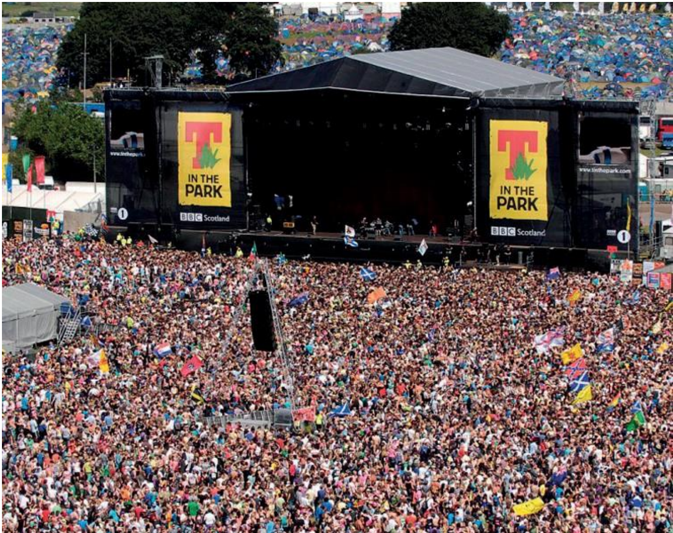
T IN THE PARK festivalis

Kūrybiškumas Inovacijos Rinkos galimybės Individualizuotos strategijos