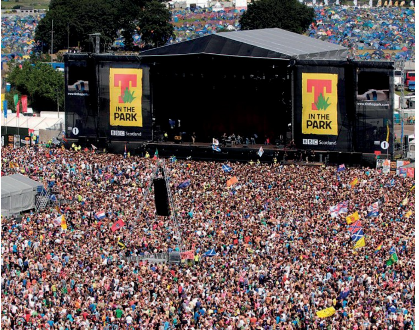
T IN THE PARK festivali

Yaratıcılık İnovasyonu Pazar fırsatları Kişiyeye özel stratejiler