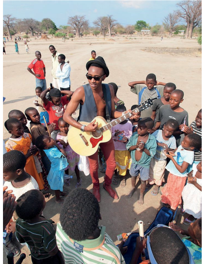
Lake of Stars Festival Malawi

Malawi'deki Laker yıldızları festivalinde toplulukla çok yakın çalışıyoruz ve bölgede iki okul var. Bunlardan biri, okulu ziyaret ettiğimde okul çocuklarının öğretmeninin önünde beton bir zeminde ders çalıştıklarını, sıraların olmadığını fark ettim. Okulun müdürüyle konuştum. O da bana festival sonunda sahneyi ne yapacağını, festivale özel yaptığımız ahşap bir sahneyi dedi. O sahneyi okula verdik, onlar da sahneyi sıraya dönüştürdüler. Bir yıl sonra tekrar gittiğimde sınıflara girdim ve çocuklar festivalin kullandığı, sanatçıların çaldığı sahneden yapılmış bu sıralarda oturuyorlardı. Bana göre bu harika bir Döngüsel Ekonomi hikayesi. Becerilerini ve çabalarını kullanırlar. Sadece normalde almaya güçlerinin yetmediği oduna ihtiyaçları vardı.